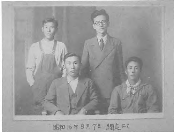
昭和16年9月7日 網走にて