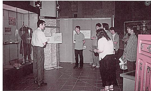
講座 特別展解説会 2004.7.18

本コーナーでは、上着やズボン、帽子、手袋など、ツンドラの厳しい寒さにも耐えられるトナカイの毛皮製品を中心に、コリヤークのトナカイ橇、投げ縄、ナイフなど、トナカイの利用に関連した日常生活用具も展示しました。また、パソコンをもちい、映像と音声によってコリヤークの民話を紹介する電子絵本のコーナーを設けました。