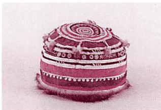
H16.70 トナカイ皮製男性用帽子