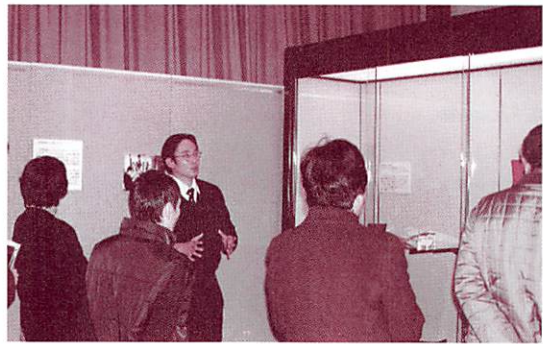
企画展解説会の様子

仮面などを収集し、また彼らの一部が伝統的なデザインに基づいた彫刻、仮面などの制作や言語の復活を通じて文化の復興につとめている様子を報告しています。