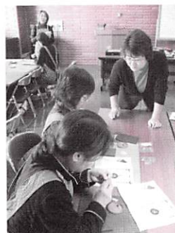
ビーズ・毛皮付きポーチ