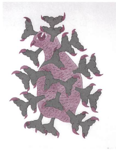
「はやぶさ」 M. イッサ作 カナダ/ベーカー・レイク