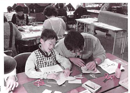
革でつくる 動物仮面