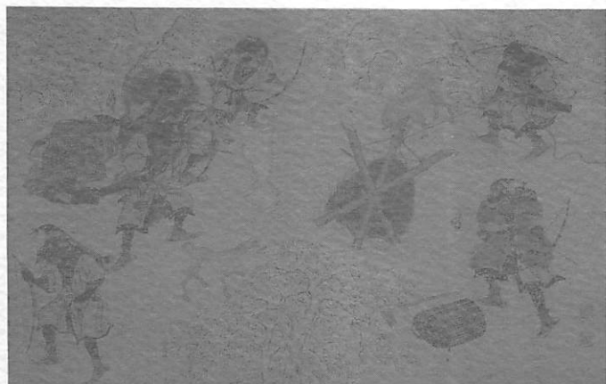
アイヌ熊狩の図(平沢屏山) 市立函館博物館蔵

今回の特別展では、とくに北海道アイヌの生業活動のなかの狩猟と漁撈について、さまざまな民族資料や考古資料、アイヌ風俗絵などをおして紹介します。