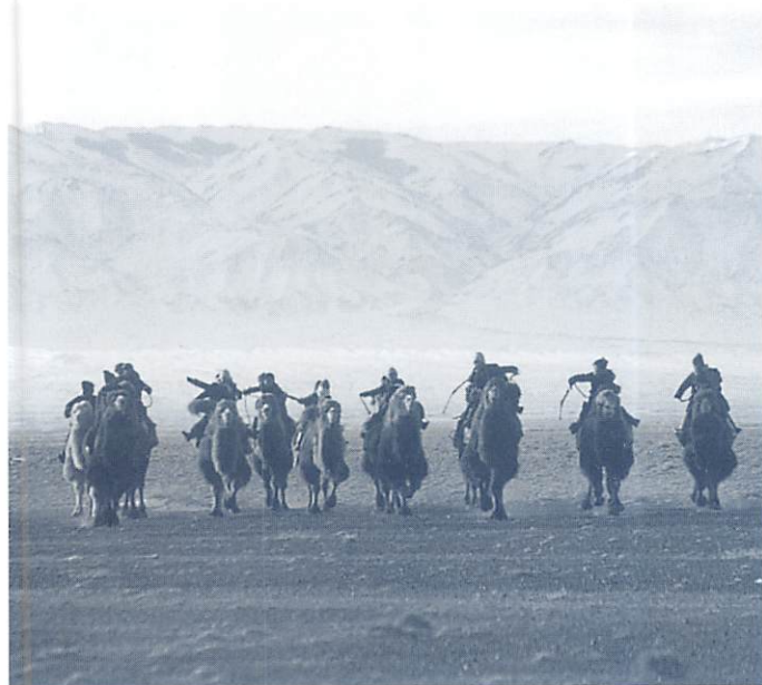
ラクダで通学する子供たち／モンゴル・ゴビ砂漠