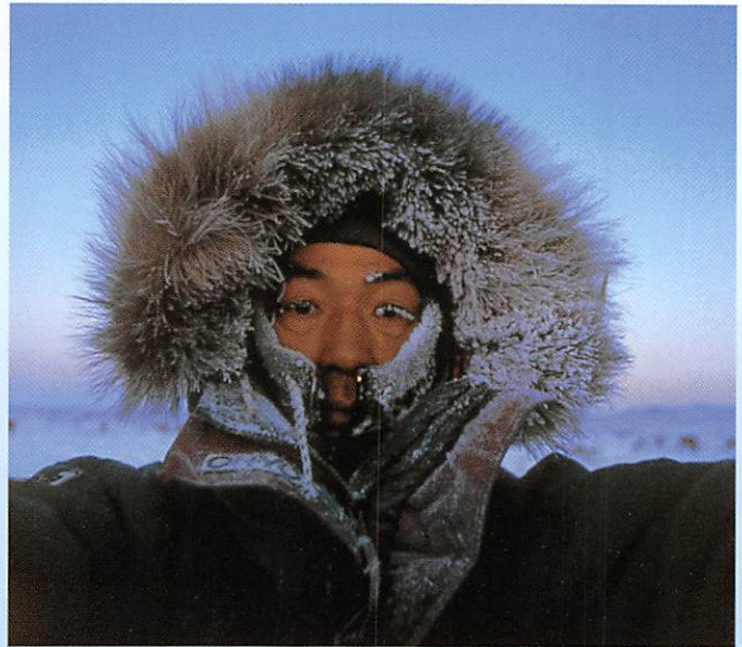
関野 吉晴 氏/シベリア