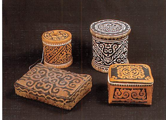
うずまきを主体にした、民族をこえて似通った特徴の文様をもつ白樺樹皮製容器

奥2点 ナーナイ (右リサ=グレゴリー=ブナ=バラノバ作) 手前左 ウイルタ 右 ウリチ