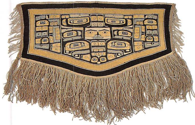
紋章が織り込まれた チルカットローブ トリンギット