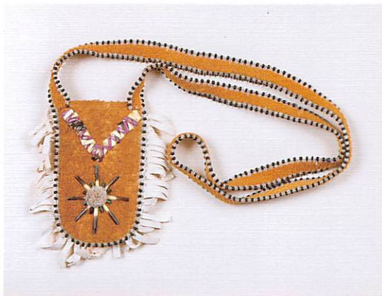
古い素材(ヤマアラシの針:クイル)と新しい素材(ガラス製ビーズ)で装飾された薬用バッグ アサバスカインディアン/グイッチン (ドリス=ウォード作)