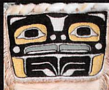
Northwest Coast Indians