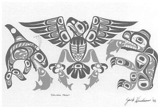
版画「サケの祝宴」(ツィムシャン/ Jack Hudson 作)