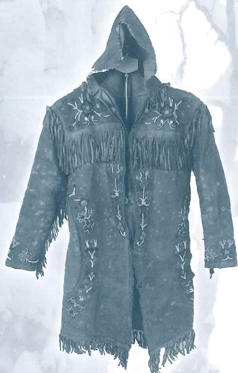
フード付ビーズ刺繍ヘラジカ皮製衣服