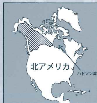
アサバスカ・インディアン居住地