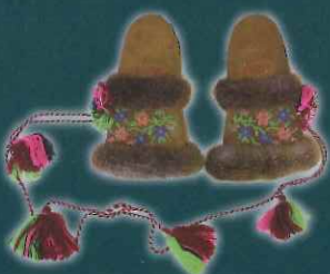
ヘラジカ皮製手袋（ミトン）