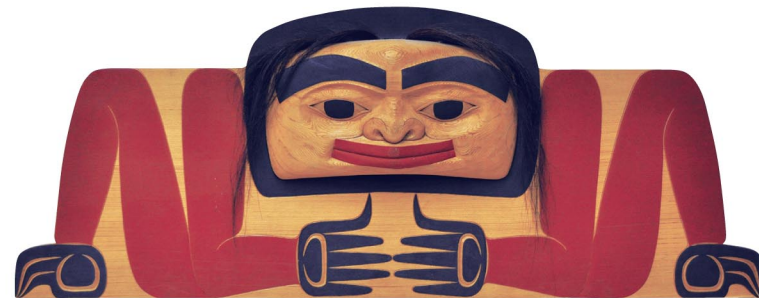
HOKKAIDO MUSEUM OF NORTHERN PEOPLES