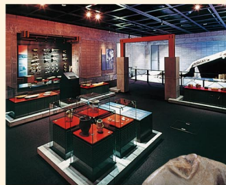
牙制女性像 MOYORO 贝冢出土

北方民族为了不辜负获得的食物，并且要为度过漫长冬季做准备，所以干燥和熏制技术非常发达。