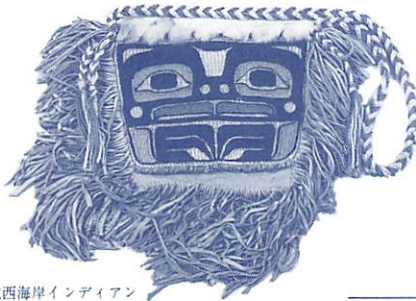
バッグ/北西海岸インディアン