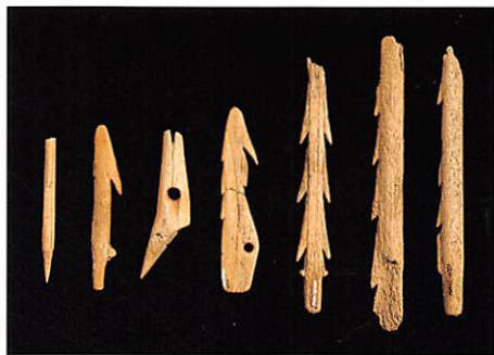
もり 槍先 やり 槍先

◆海洋と切り離すことのできない生活を示す遺跡はアラスカ半島の他の地域にも点在しているが、とくにホットスプリング遺跡の周辺には、長期間、生活の場として利用される条件が備わっていたと考えられる。