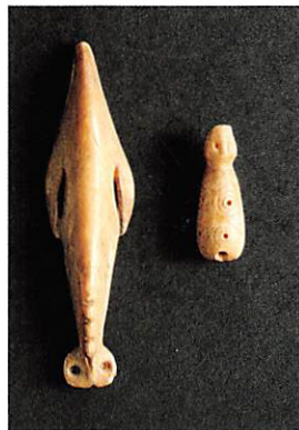
動物形の 骨角製品