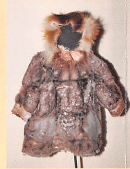
鳥皮製子ども用パーカ (イヌイト/アメリカ・アラスカ州)