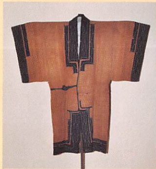
樹皮製衣「アットゥシ」(アイヌ/北海道)