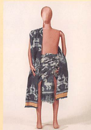
インドネシアの男性用腰巻・肩掛け「ヒンギ」(東京家政大学博物館所蔵)