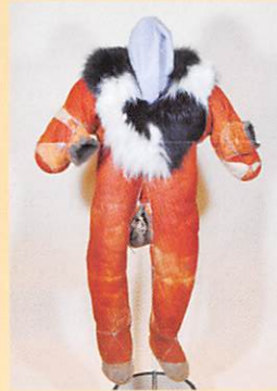
トナカイ毛皮製子ども用つなぎ (コリヤーク/ロシア・マガダン州)