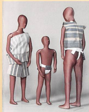
台湾先住民ヤミの成人男女と少年の伝統衣装 (東京家政大学博物館所蔵)