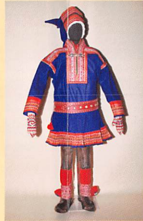
男性の伝統衣装 トナカイ毛皮製ズボンとブーツ (サミ/フィンランド・エノンテキオ地方)

一般に寒冷地の哺乳動物は、暖かな毛皮で覆われていますが、ヒトは特定の部位を除いて体毛が退化しています。北方地域の人びとは、衣類や住居などに他の動物の毛皮を用いてきたわけですが、トナカイをはじめとするシカ類やアザラシ類など、その肉も食用となる大型獣を中心に捕獲しました。そして、暖かく軽いトナカイの毛皮は冬の衣服に、水に強いアザラシの毛皮は履き物にするなど、さまざまな種の毛皮をその特性に合わせて使い分けました。さらに、体温で暖められた衣服の中の空気を逃さないように、フードやつなぎなど形も工夫されました。また、皮をしなやかで長持ちさせるための鞣しや、丈夫で美しい縫製の技術も伝えられてきました。毛皮の衣類とそれを作る道具類などを展示します。