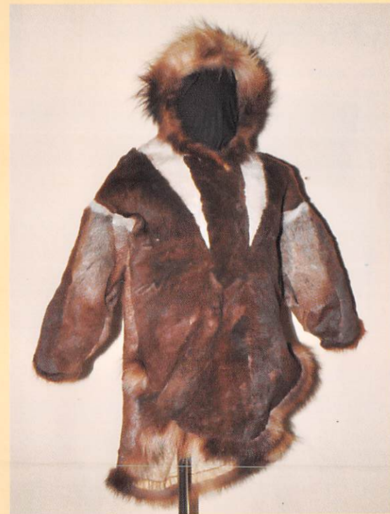
トナカイ毛皮製パーカ (イヌビアク/アメリカ・アラスカ州)

Reindeer Fur Parka and Sealskin Boots: Traditional Clothing of Northern Peoples