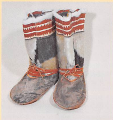
アザラシ毛皮製ブーツ (コリヤーク/ロシア・カムチャツカ地方)

人類が北方の寒冷な環境へと生活の場を広げるためには、さまざまな知恵と技術が必要でした。その最も重要なものの一つが、衣類です。本展では、北方の先住民が伝えてきた衣類の素材、機能、技術などの特徴について、世界の他地域の衣文化と比較しながら紹介します。