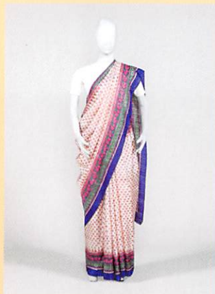
インドの女性用衣装「サリー」 (東京家政大学博物館所蔵)