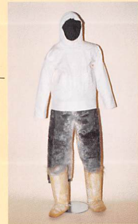
狩猟用の男性の衣服 アザラシ毛皮製のズボンとセイウチ皮製のブーツ (イヌイト/グリーンランド)