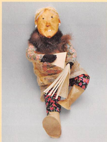
アザラシ腸製上着を着た人形 (チュピック/アメリカ・アラスカ州)