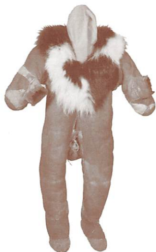
トナカイ毛皮製子ども用つなぎ (コリヤーク/ロシア・マガダン州)