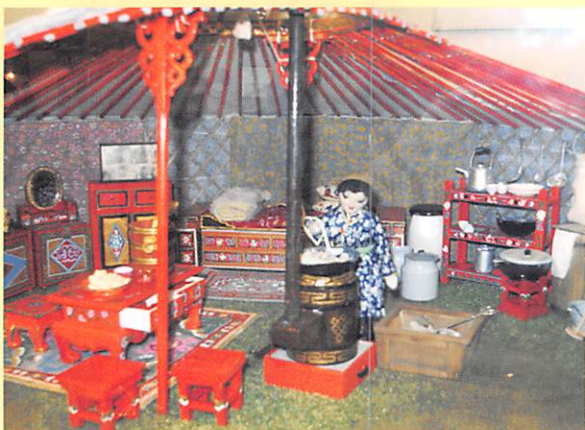
モンゴル・遊牧民の台所