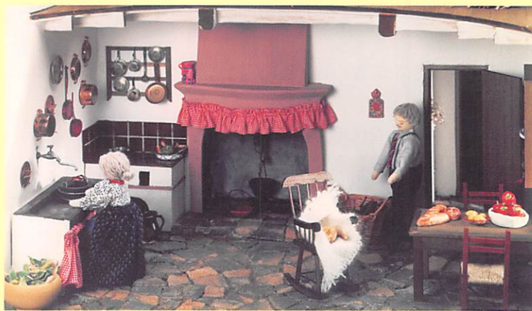
イタリア・トスカーナ地方の台所