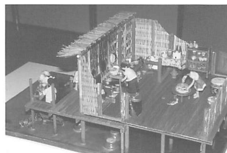
タイ・水上生活者の家