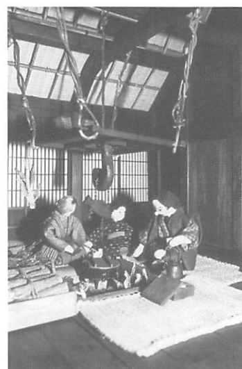
富山・五箇山の林業家