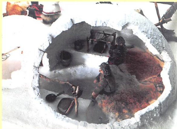
カナダ極北・パフィン島の台所/イヌイト