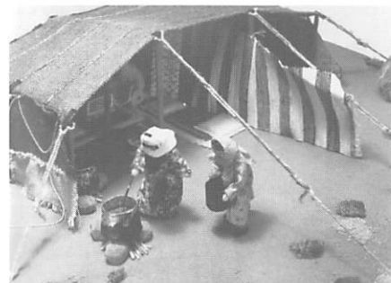
シリア・遊牧民のテント