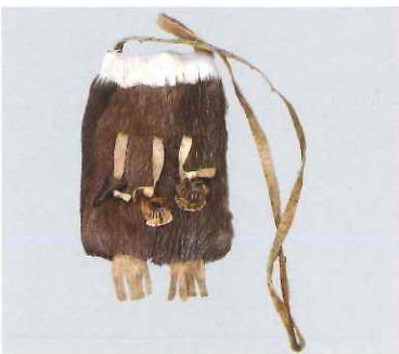
塩入れ袋 / エベンキ (ロシア / ザバイカル地方)