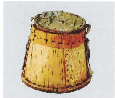
白樺樹皮製ミルク容器 / ドウハ (モンゴル / フブスグル県)