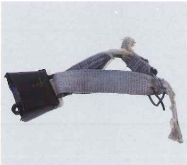
トナカイ用鈴 / ウイルタ (ロシア / サハリン州)

ユーラシア大陸北部で広く先住民の生業として営まれてきたトナカイ遊牧は、自然環境や携わる民族集団によって地域ごとに多様な展開をみせてきました。本特別展では、シベリア東部から南部にかけてのタイガ（北方針葉樹林帯）地域に広がるトナカイ遊牧文化を紹介します。(写真:2010年、エベン、ロシア/サハ共和国)