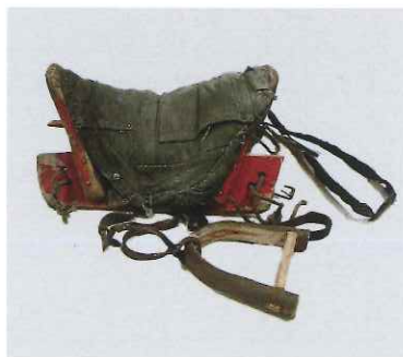
トナカイ騎乗用鞍 / ドウハ (モンゴル / フブスグル県)