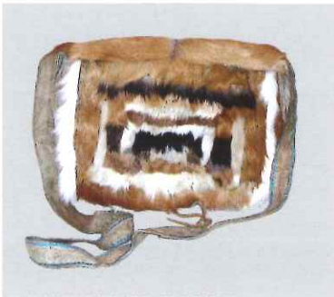
ノロジカ毛皮製バッグ / エベンキ (中国 / 内モンゴル自治区)