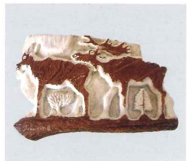
トナカイ角製彫刻 / エベン (ロシア)