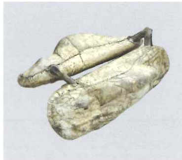
トナカイ騎乗用鞍 / エベンキ (ロシア / サハ共和国)