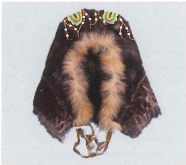
トナカイ毛皮製帽子 / エベン (ロシア)