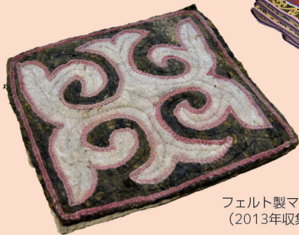
フェルト製マット (2013年収集)