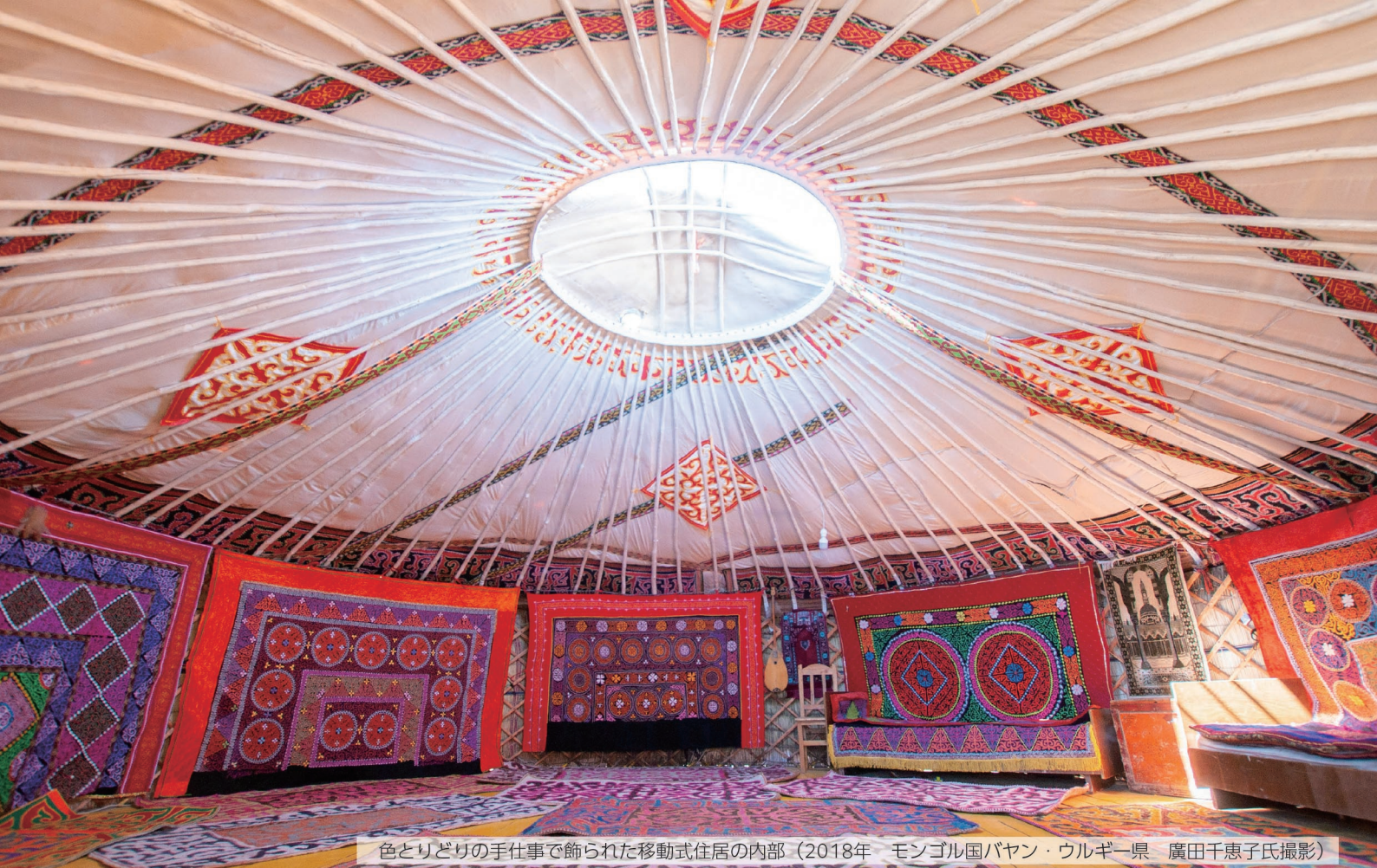
色とりどりの手仕事で飾られた移動式住居の内部（2018年 モンゴル国バヤン・ウルギー県）